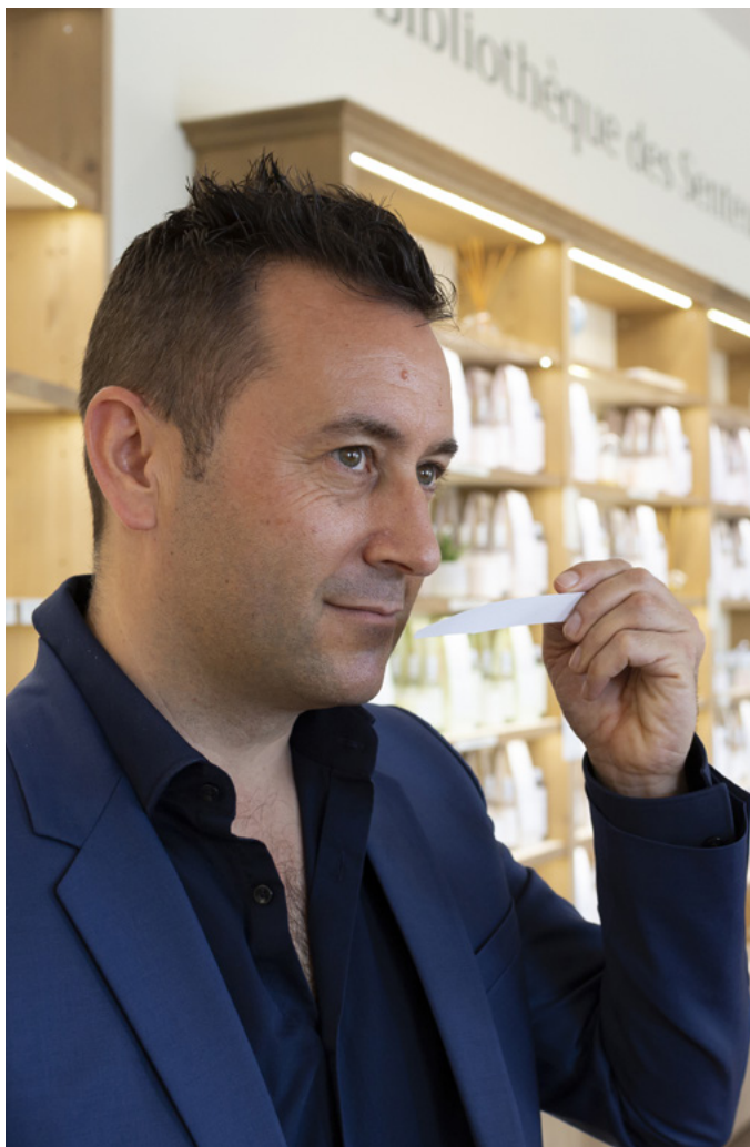
Le projet de deux passionnés de nature et d'arômes.