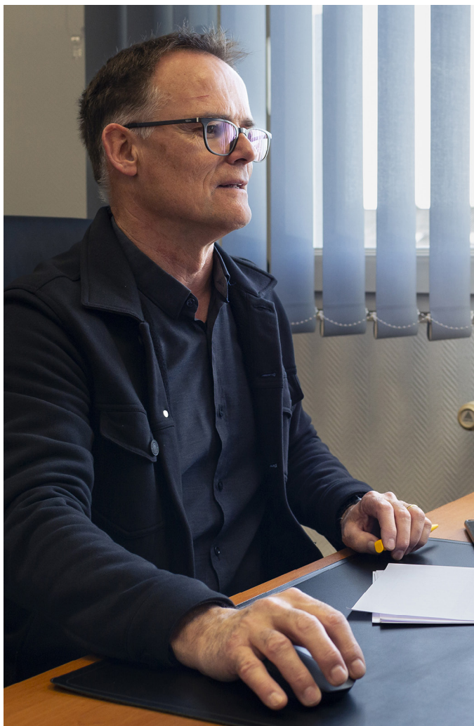
Une activité portée par les impératifs de sobriété énergétique.