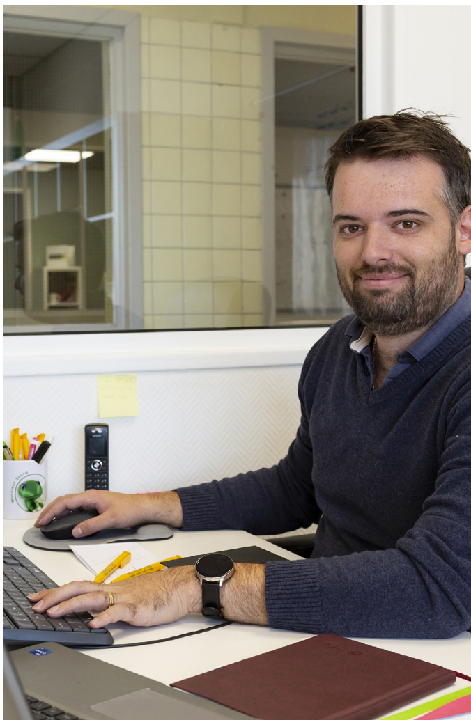
Une solution en phase avec les pratiques d'utilisation d'aujourd'hui.