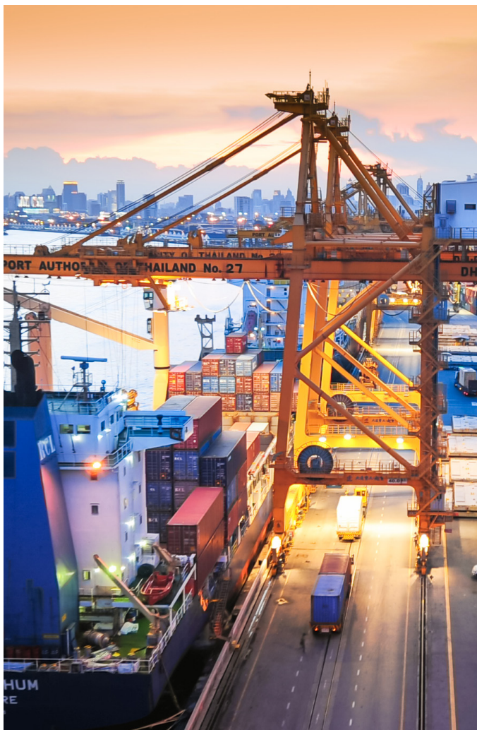
Sage X3 retenu pour sa fiabilité et sa puissance d'analyse.