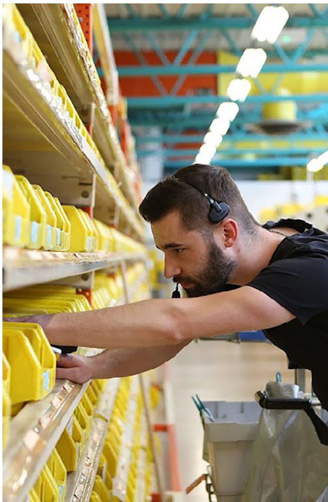
Un système d'information de gestion cohérent et évolutif.