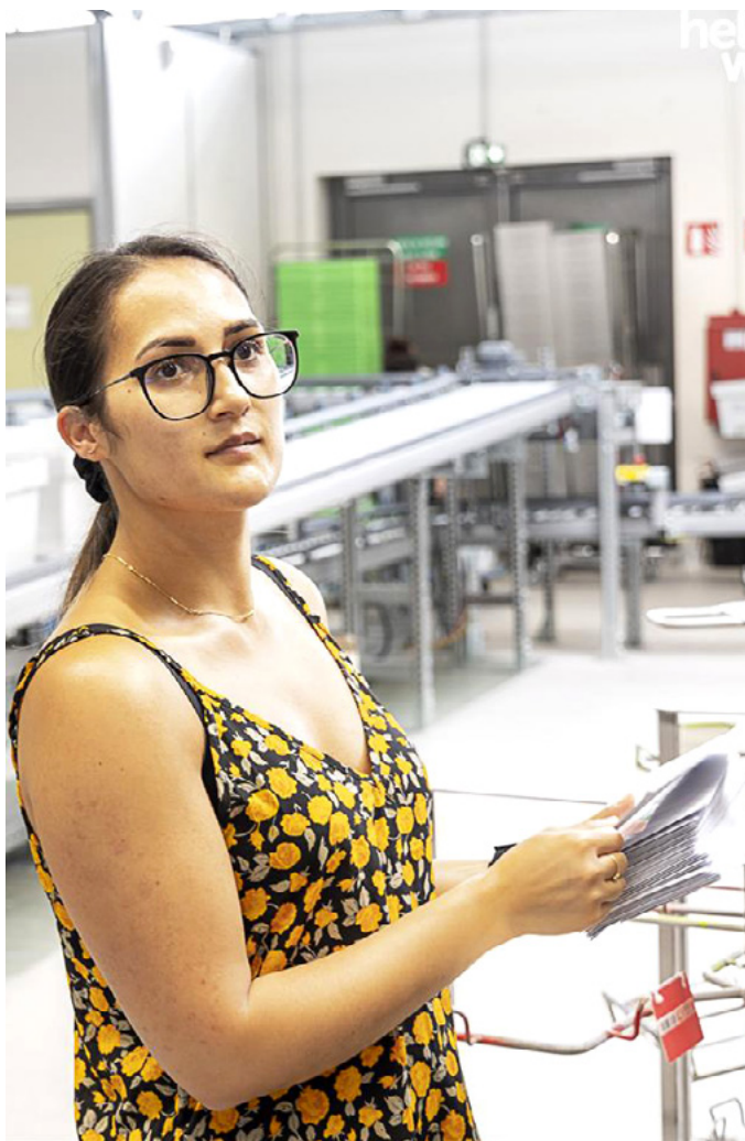
Une réponse engagée au défi de la disponibilité des médicaments dans les officines.