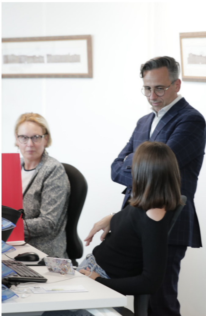
La dématérialisation intégrale du processus procure-to-pay est le prochain défi