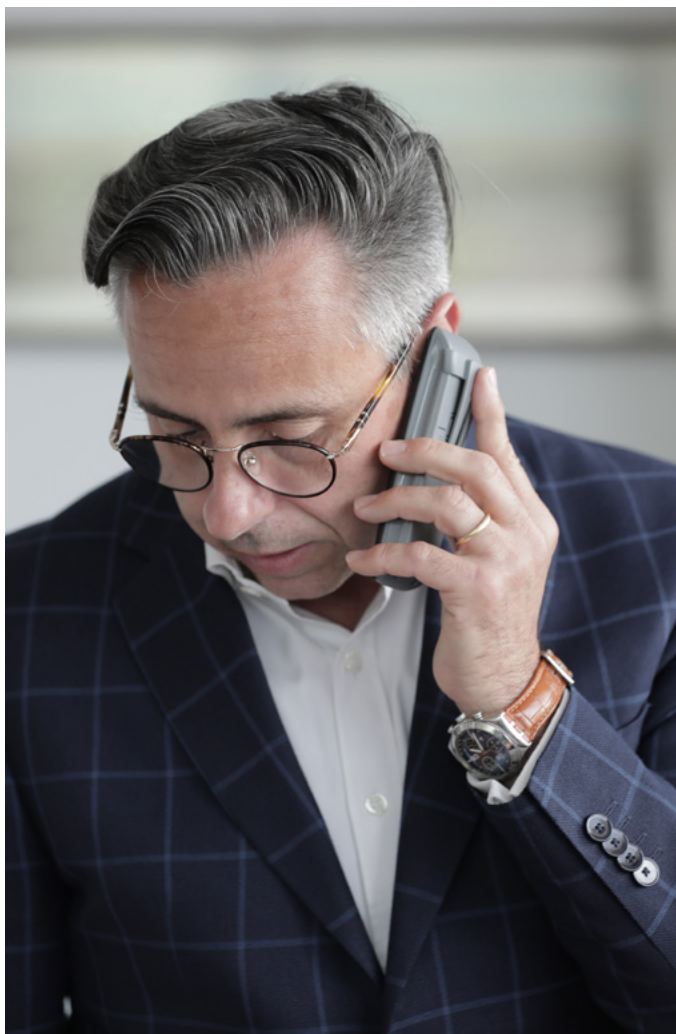
Un pionnier de la transformation numérique qui a toujours fait confiance à Sage.