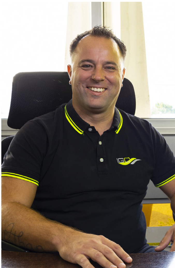
Une entreprise familiale dont le maître-mot est l'engagement.