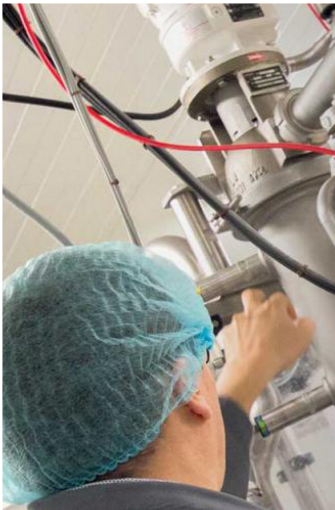
Un ERP nativement conçu pour la mondialisation.