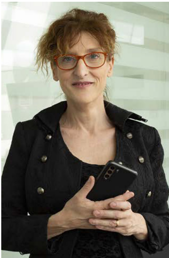
Une adaptation permanente aux besoins de l'entreprise.