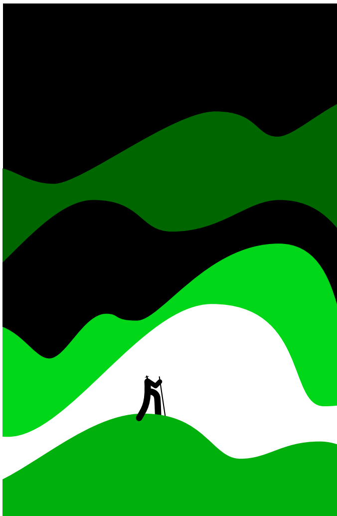
Un outil intuitif au service de la croissance du Groupe.