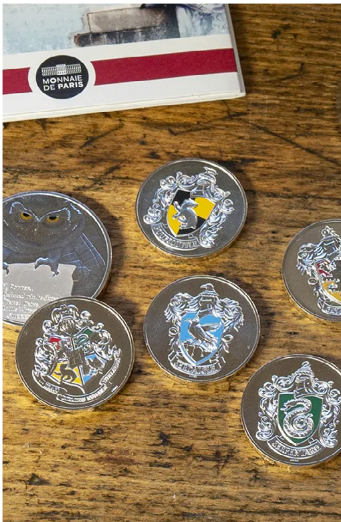
Une activité muséale et la location d'espaces de prestige s'ajoutent au métier historique de métallurgie.