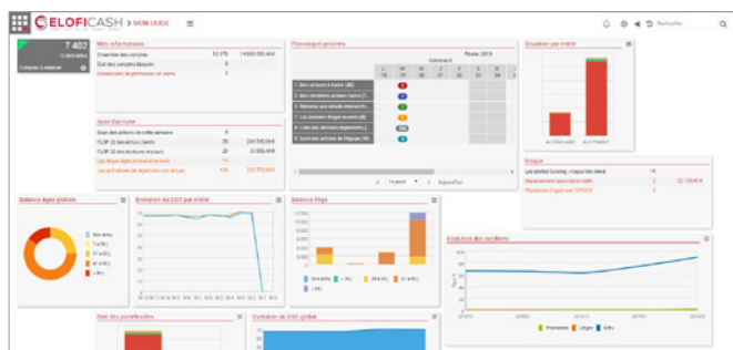
Tableau de bord personnel Mon risque