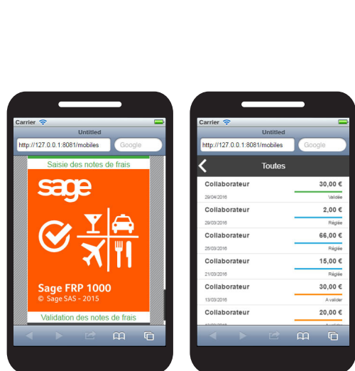
Sage FRP 1000 Notes de frais - Tableau de bord manager

bénéficie d'une plateforme technologique moderne et d'outils collaboratifs intégrés vous permettant un suivi des notes de frais en toute transparence entre vos collaborateurs, leurs managers et votre direction financière.